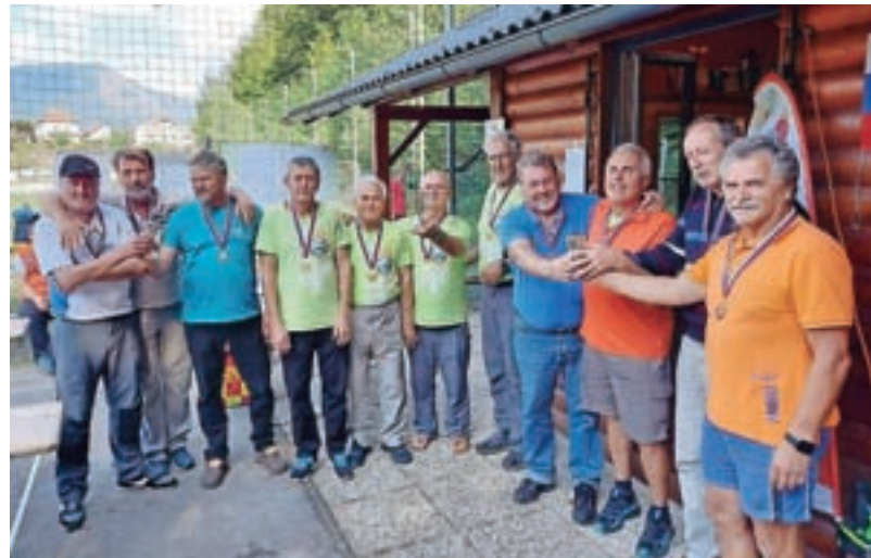
Prvenstvo društev upokojencev v prstometu 2021 v organizaciji ŠD Rokce